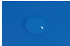
Gota después de 2 segundos