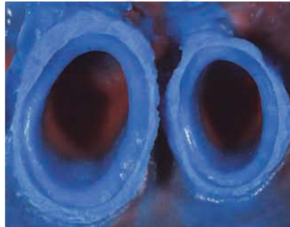
Detalle de la impresión con ELITE HD+ light fraguado normal

La aplicación de nanopartículas (20 nanómetros) tratados a nivel molecular con agentes hidrófilos polares, permite a ELITE HD+ alcanzar una fluidez ideal en contacto con los surcos gingivales.