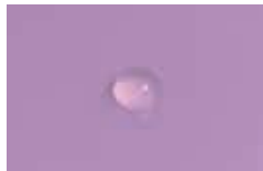
Gota después de 2 segundos